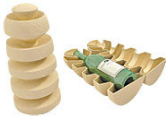
אריזה ליין מחומר של תבנית ביצים

<< איך אורזים בקבוק יין שקניתם במתנה לחג? באריזת נייר? ואולי בקופסה כבדה ומסורבלת? השאלה הזו העסיקה את חברי קבוצת העיצוב אוממי, שהעדיפו לא להשאיר ברמה התיאורטית, אלא למצוא לה פתרון.